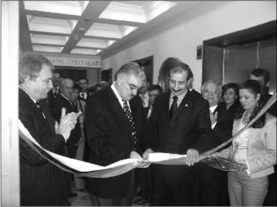
Mersin Barosu Hizmet Binası etkinliklerle açıldı.

Türkiye Barolar Birliği, Avrupa Konseyi ve TAİEX Ofisinin ortaklaşa düzenledikleri İnsan Hakları Avrupa Sözleşmesi (İHAS) ve İnsan Hakları Avrupa Mahkemesi (İHAM)'nin kararları ile bu konulardaki Türk Mevzuat ve uygulamalarının tanıtılıp tartışıldığı eğitim seminerleri ev sahibi barolarımızın katkıları ile devam etmektedir. Seminerlerin ilki Trabzon'da ve yedincisi de Antalya'da yapıldı. İzmir Ankara ve İstanbul'da yapılacak son üç seminerle tamamlanacak olan program ilgi ile